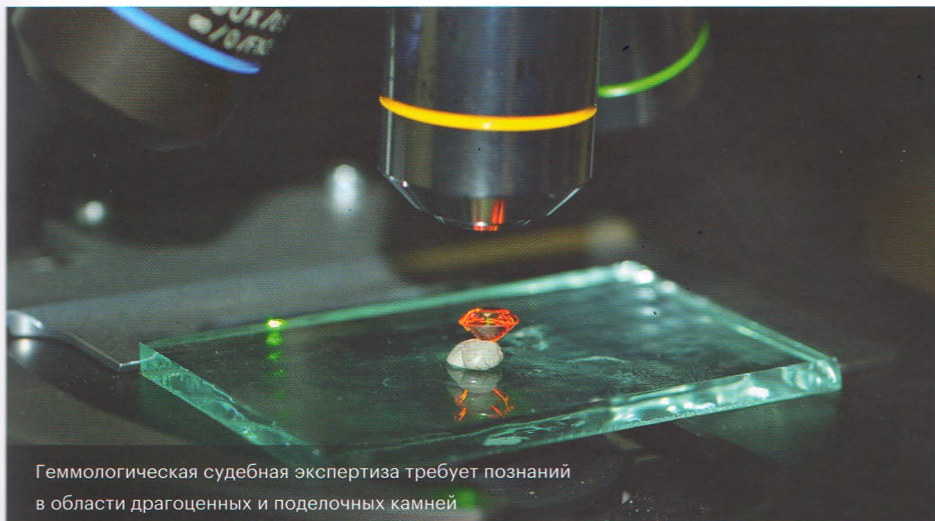
Геммологическая судебная экспертиза требует познаний в области драгоценных и поделочных камней