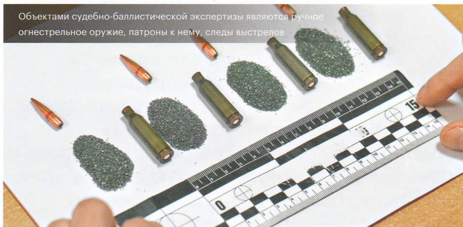
Объектами судебно-баллистической экспертизы являются ручное огнестрельное оружие, патроны к нему, следы выстрелов

судебно-экспертных учреждениях (СЭУ) Минюста России на современном научном уровне и оказывает информационно-консультационную поддержку правоохранительным органам и судам по вопросам назначения и производства судебных экспертиз и экспертных исследований.