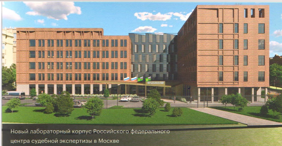
Новый лабораторный корпус Российского федерального центра судебной экспертизы в Москве