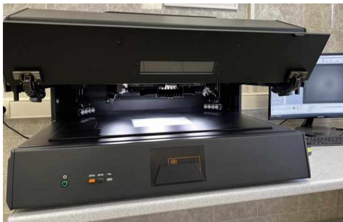
Иллюстрация 1. Общий вид видеоспектрального компаратора «Регула» 4308S.