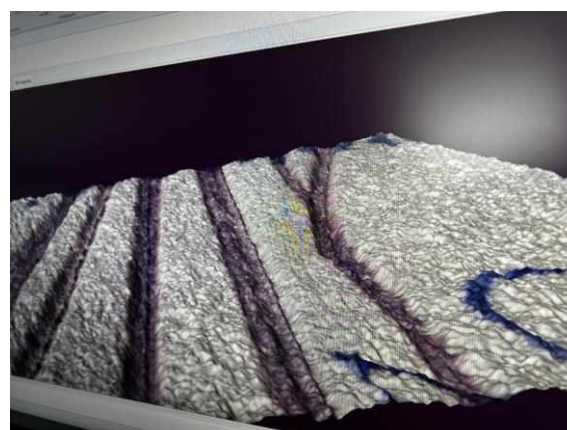
Иллюстрация 3. 3-D модель рукописных штрихов, выполненных перьевыми ручками.